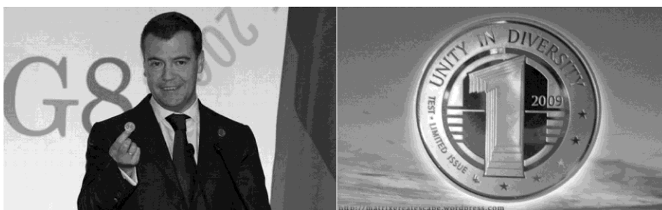
俄罗斯总统手持一枚为全球设计的货币（左图）；货币上用英文写着“Unity in Diversity”（右图）

今年在意大利G8峰会上，俄罗斯总统拿出一枚为全球设计的货币，货币上用英文写着“Unity in Diversity”（多样性中的统一）。虽然发明这种货币的设想被多数人理解为对抗美元，但货币上的这句话，却道出了未来社会最重要的特征——“多样性中的统一”。这也是1931年1月28日守基·阿芬第在《新世界体制之目的》中阐述的一个重要观点，他在讲话中这样解释未来全新的人类一体的全球性体制：“它绝不是旨在颠覆现有的社会根基，而是寻求扩大其基础，重铸其机构，以符合这个不断变化之世界的需求。它既不会与合理的效忠精神相抵触，也不会削弱必要的忠诚。它的目的既不是窒息人们心中理智的爱国主义火焰，也不是要废除国家自主的制度（如果要避免过度集权之灾难，这是非常必要的）。它既没有忽视，也没有试图压迫世界上各种族的不同根源，或忽略气候、历史、语言、传统、思想与习惯等方面的多样性。它召唤更宽厚的忠诚、更博大的抱负，超越于任何曾经激励过人类的忠诚与抱负。它坚持认为国家主义冲动和利益必须服从统一的世界之迫切要求。一方面，它否认过度的集权，而另一方面它又否认有一律化的企图。它的口号是：多样性中的统一。”